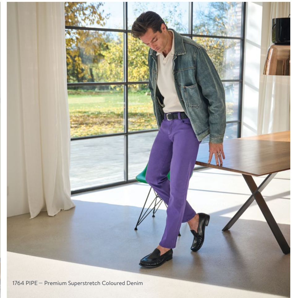
1764 PIPE — Premium Superstretch Coloured Denim