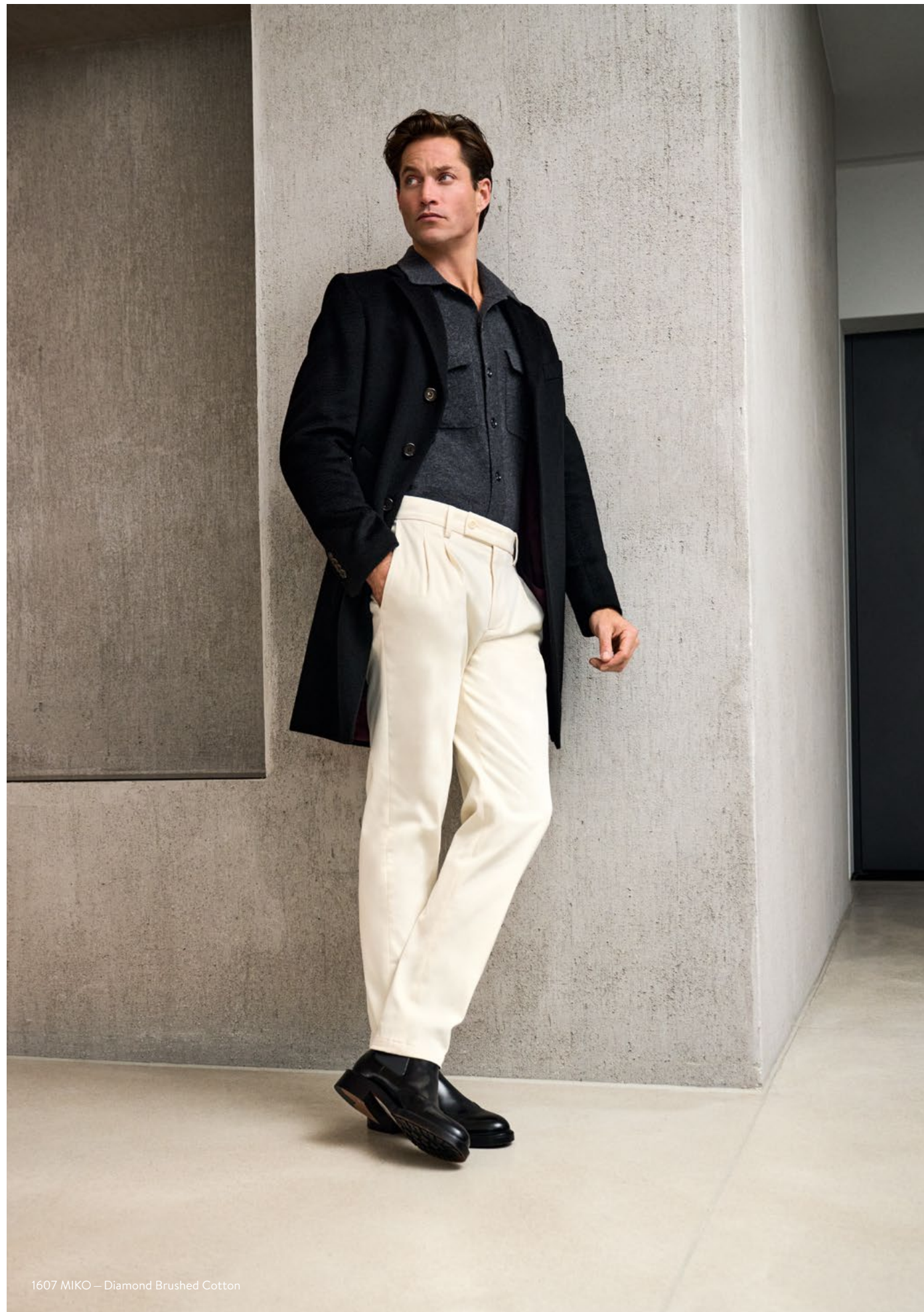
1607 MIKO – Diamond Brushed Cotton