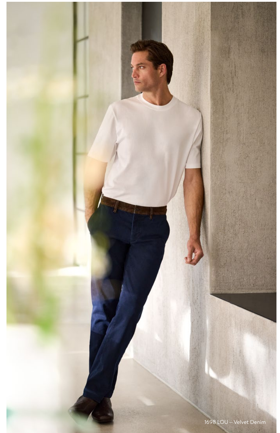
1698 LOU – Velvet Denim