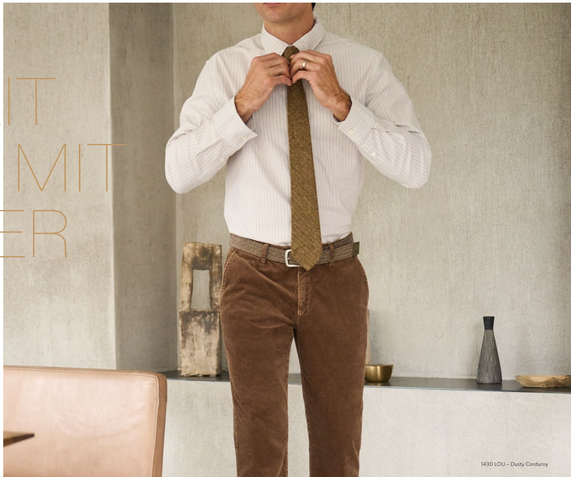
1430 LOU – Dusty Corduroy

Ob beim Spaziergang im Park, bei einem Espresso im Lieblingscafé oder auf einer kurzen Reise aufs Land – wer in den kalten Monaten weder auf Komfort noch auf Stil verzichten will, sollte bei der Hosenwahl genau hinschauen. Komfort, Wärme und Bewegungsfreiheit stehen hier immer im Fokus. ALBERTO liefert dafür echte Allrounder: smart designt, funktional und bequem – Pants, die jeden Moment mitmachen und dabei noch verdammt gut aussehen.